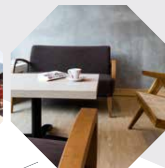
Nouveau salon spacieux et moderne avec son bar propice à la détente et la convivialité, deuxième salon cosy avec cheminée et bibliothèque