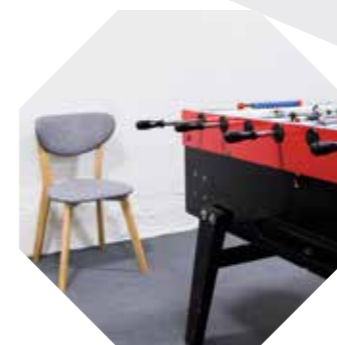
Salle de jeux de société avec baby-foot