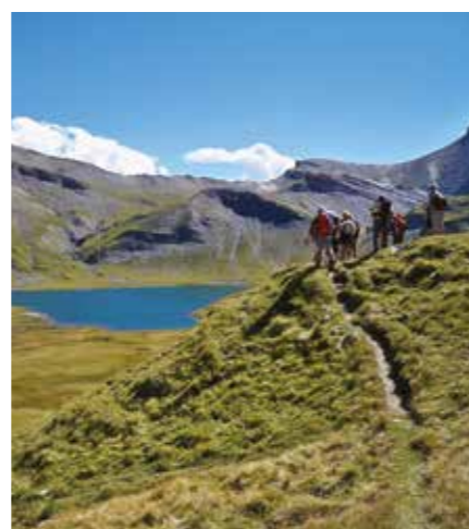
Anterne Un vaste plateau d'altitude où se cachent un lac et un refuge, un paysage grandiose au pied de la chaîne des Fiz.