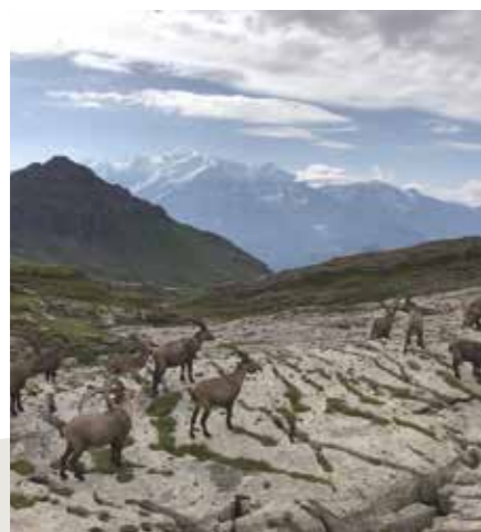
Le fascinant Désert de Platé Reconnu comme l'un des plus grands lapiaz d'Europe, avec le Mont-Blanc en toile de fond !