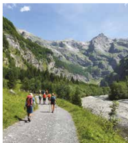
Le Fer à Cheval Site incontournable classé Grand site de France, il vous réserve un décor de rêve au cœur de la réserve naturelle de Sixt/Passy...