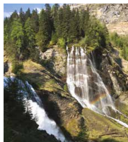
Le vallon de Sales Des paysages variés tout au long de la journée, cascades, faunes, flore au RDV et vue Mont-Blanc en arrivant au Dérochoir !