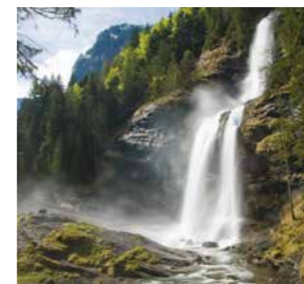
La Cascade du Rouget