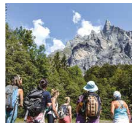
Le Cirque du Fer à Cheval